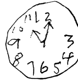
Faltan algunos números